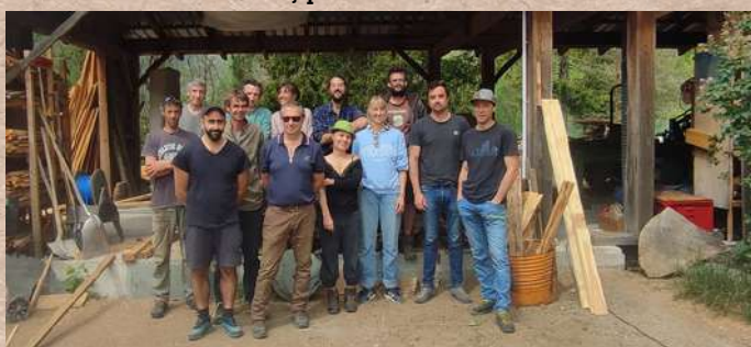
Le Conseil d'Administration (incomplet)

Une autre partie de subventions nous a permis de financer un accompagnement dans notre fonctionnement.